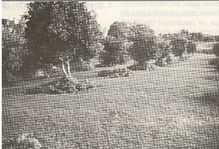
Foto 1. Uso de Mucuna en plantación de frutales perennes para controlar erosión, mantener la humedad y control de malezas.